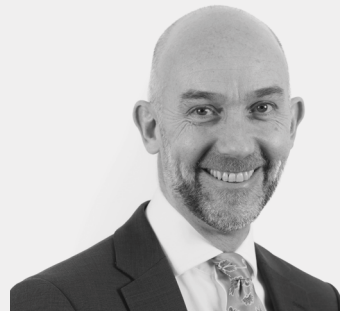
Adrian Crompton Archwilydd Cyffredinol Cymru

Rwy'n sylweddoli ei bod yn her ceisio gwario cymaint â phosibl o gronfeydd yr UE sy'n weddill. Mae cwblhau'r rhaglenni yn brin yn golygu colli arian i Gymru ond byddai eu cwblhau yn y cyfeiriad arall yn gallu golygu bil sylweddol i Lywodraeth Cymru. Er gwaethaf amgylchiadau anodd, mae'n galonogol gweld bod WEFO a Llywodraeth Cymru wedi ymrwymo holl gyllid yr UE a bod y rhaglenni ar drywydd cadarnhaol o ran gwariant. Mae angen cynnal y cynnydd hwnnw gan hefyd reoli risgiau sylweddol a sicrhau gwerth am arian.