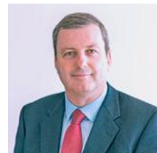
Gareth Davies, Rheolwr ac Archwilydd Cyffredinol, Y Swyddfa Archwilio Genedlaethol