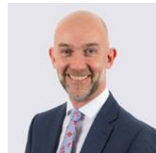
Adrian Crompton, Archwilydd Cyffredinol, Archwilio Cymru